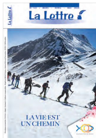
N° 142 • mars - avril - mai 2024

Nous rappelons aux lecteurs que seuls les articles signés de l'ESRB et de l'ERI expriment la position actuelle du mouvement des END. Les autres articles sont proposés comme matière de réflexion dans le respect d'une diversité fraternelle. La rédaction se réserve le droit de condenser ou de réduire les contributions envoyées en fonction des impératifs de mise en page.