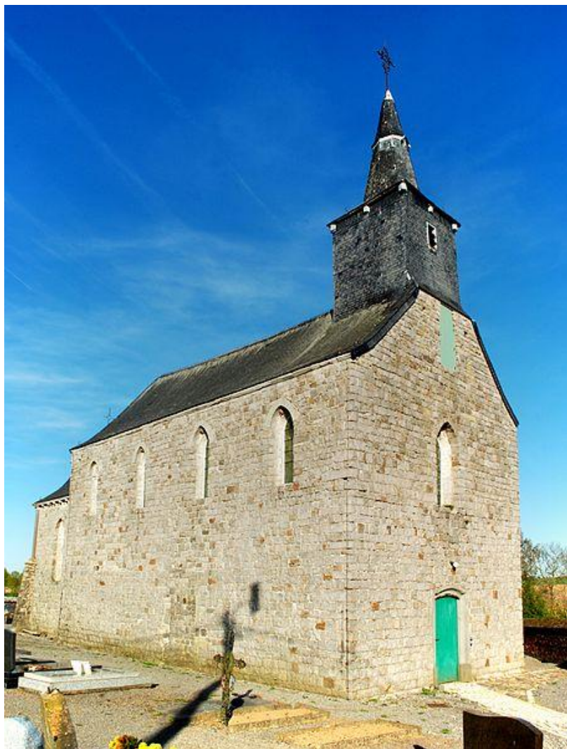
Chapelle Sainte-Catherine d'Herbais- Jodoigne