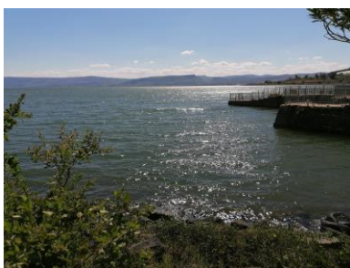
Lac de Tibériade (Capharnaüm)

Véronique & Etienne Sallets - Bruxelles 210