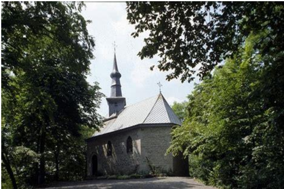
Chapelle de la Sainte-Trinité à Marche-en-Famenne Construite en style renaissance sur une légère élévation schisteuse et datant de 1610