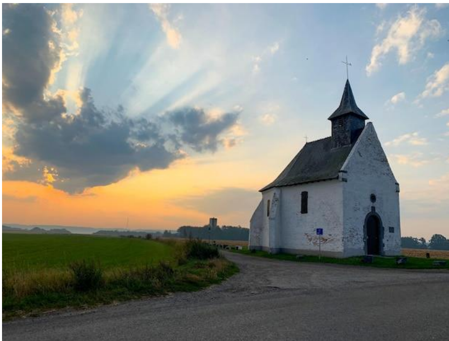
Chapelle Try au chêne - Bousval