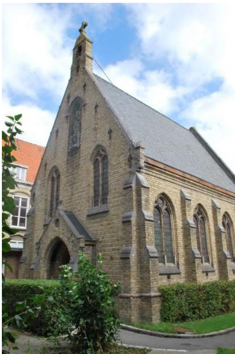
Chapelle Saint-Augustin d'Hondschoote