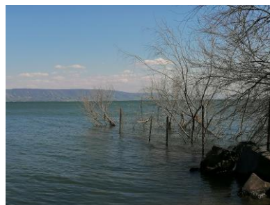
Lac de Tibériade (« pêche miraculeuse »)