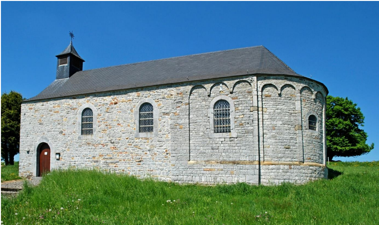
Chapelle de Limet Modave