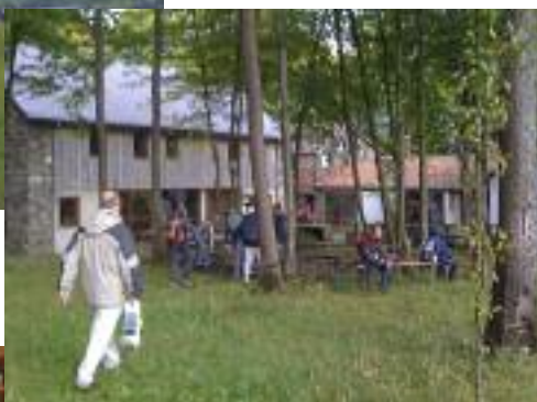
L'arrivée chez les Frères