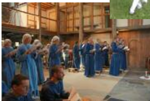
La communauté de Tibériade en prière