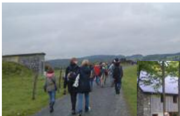
En marche vers Tibériade...