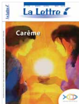
N° 118 • Mars - Avril - Mai 2018 CCED Terre Solidaire

Nous rappelons aux lecteurs que seuls les articles signés de l'ESRB et de l'ERI expriment la position actuelle du mouvement des END. Les autres articles sont proposés comme matière de réflexion dans le respect d'une diversité fraternelle. La rédaction se réserve le droit de condenser ou de réduire les contributions envoyées en fonction des impératifs de mise en page.