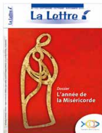
N° 112 • septembre - octobre - novembre 2016

Retraites 2016 et 2017 pour foyers et familles